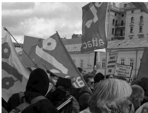
Demonstracja antywojenna w Warszawie.