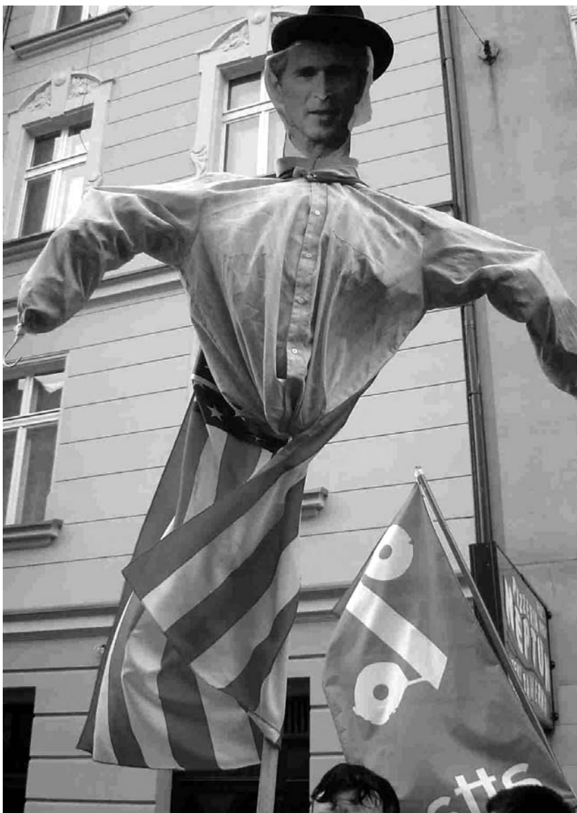
Demonstracja antywojenna w Katowicach.